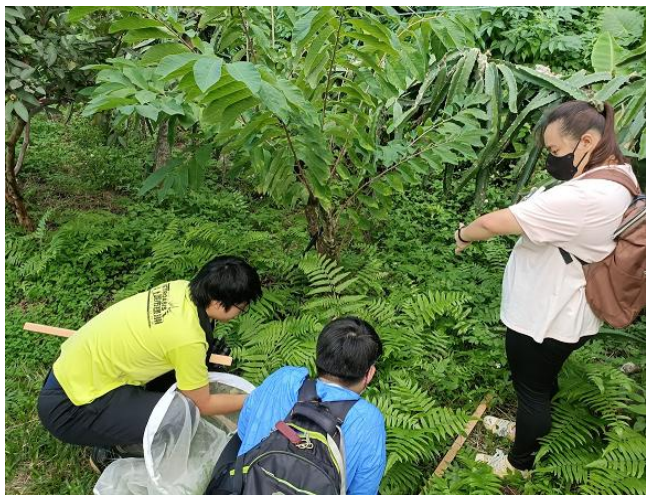
地被植物 覆蓋度、高度、優勢植物